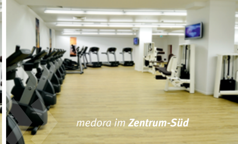
medora im Zentrum-Süd

Weitersagen lohnt sich: Wir schenken Ihnen eine POLAR -Pulsuhr im Wert von 80,-€!*