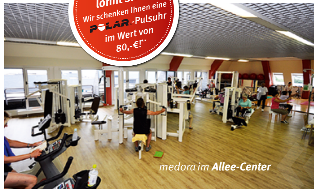
medora im Allee-Center